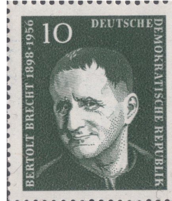
^ Bertolt Brecht Verzweifelte und litt an der Schule. Als Schriftsteller und Verfasser von Theaterstücken zählte er zu den Grossen der deutschen Literatur des 20. Jahrhunderts.