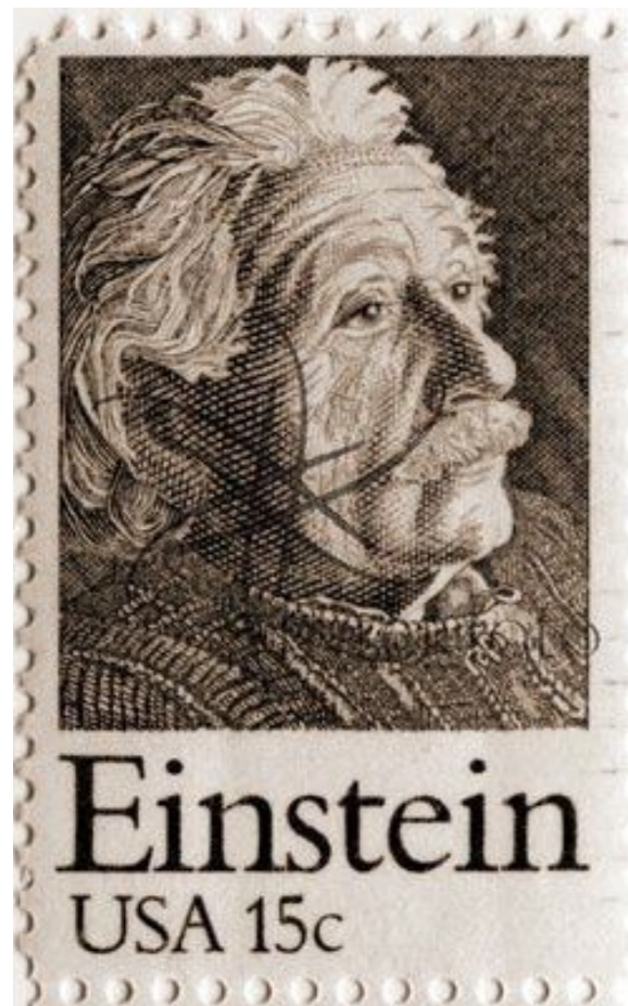
^ Albert Einstein Fiel als Schüler mit schlechten Leistungen auf und wurde später weltbekanntester Physiker, Begründer der Relativitätstheorie und Nobelpreisträger.